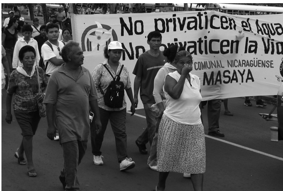
Die Frauen und Männer aus Masaya demonstrieren in Managua gegen die Privatisierung des Wassers.

braucherschutzorganisation Red de Consumidores einen Vorschlag eingereicht, der die Kommerzialisierung des Wassersektors verhindern sollte. Es ist aber zu erwarten, dass mit dem Gesetz die rechtliche Grundlage für die Privatisierung des Wassers geschaffen wird.